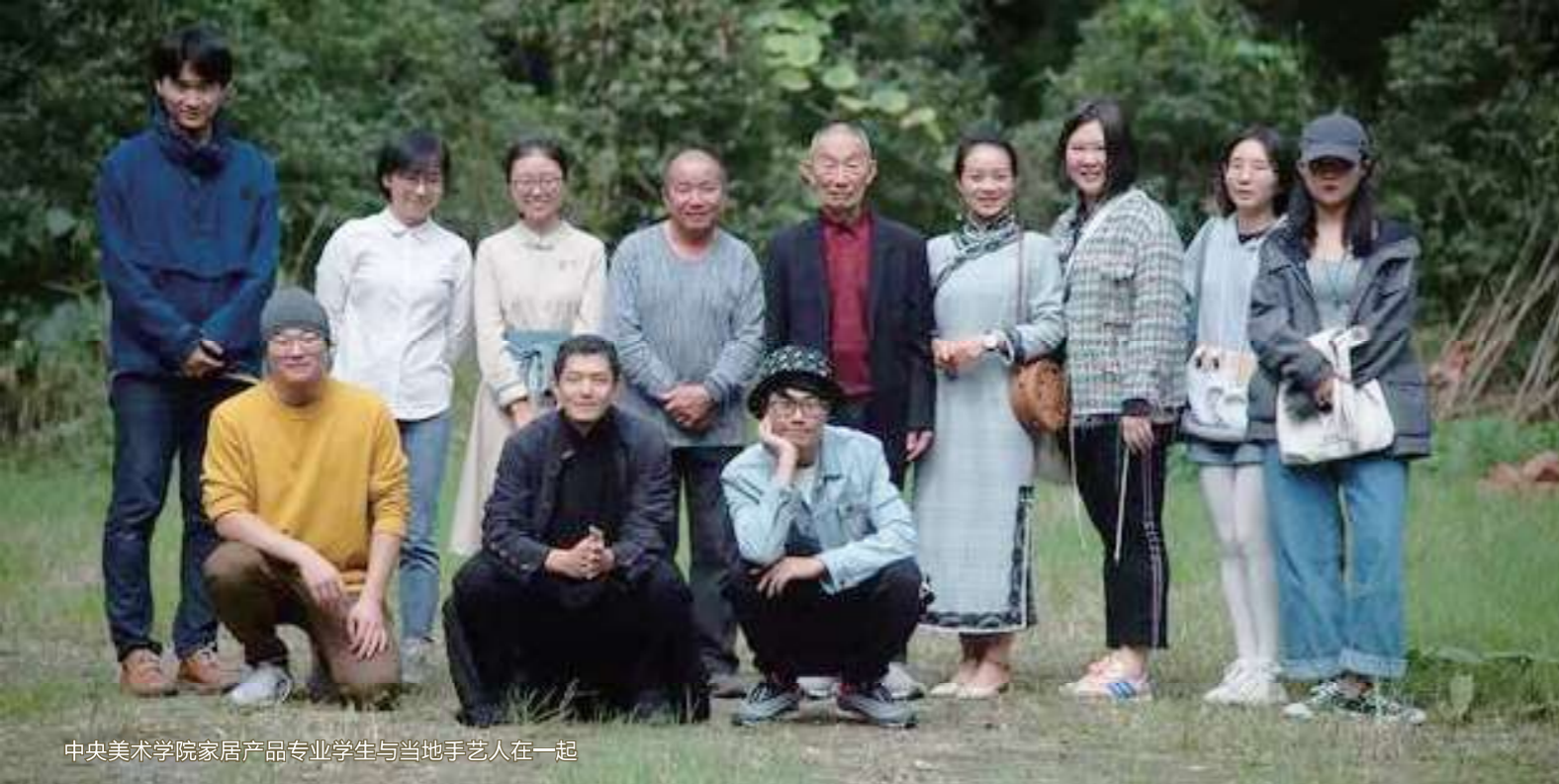
中央美术学院家居产品专业学生与当地手艺人在一起