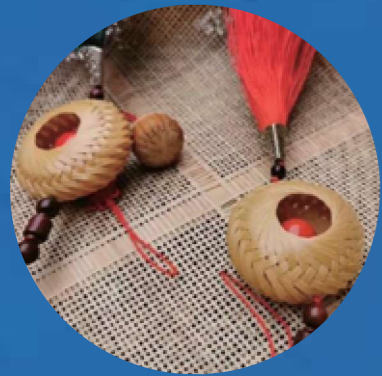
竹编“平安扣”2019年作为国礼被赠予日本首相安倍晋三夫妇