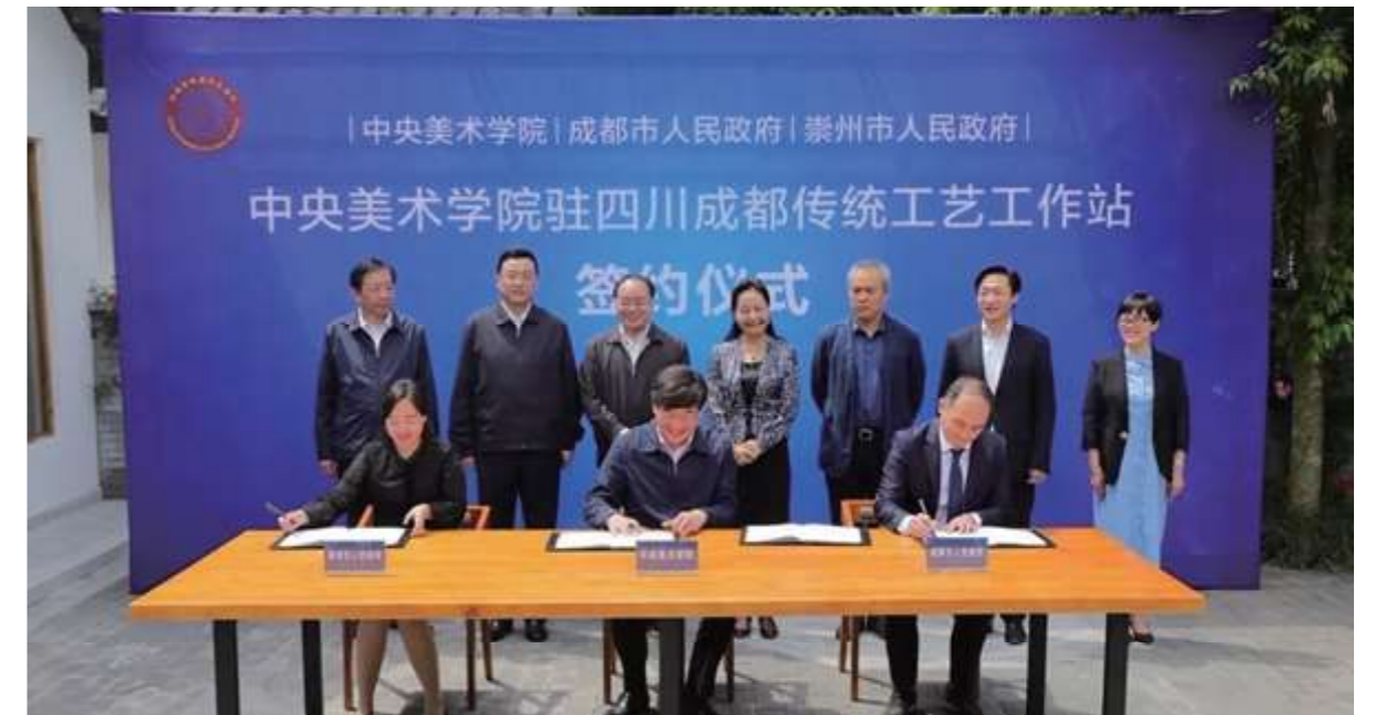
中央美术学院驻四川成都传统工艺工作站建站仪式

道明镇于2017年获成都市第一批“非物质文化遗产特色小镇”；2018年被文化和旅游部命名为“中国民间文化艺术（竹编）之乡”。道明竹编保护传承项目在2019年入选文旅部“国家级非遗代表性项目优秀保护实践案例”；2020年入选第六届中国非物质文化遗产博览会发布的《2020非遗与旅游融合发展优秀案例》。竹艺村还荣获“成都市党建引领示范社区”“四川最具投资价值森林康养基地”“中国乡村旅游创客示范基地”等荣誉称号。