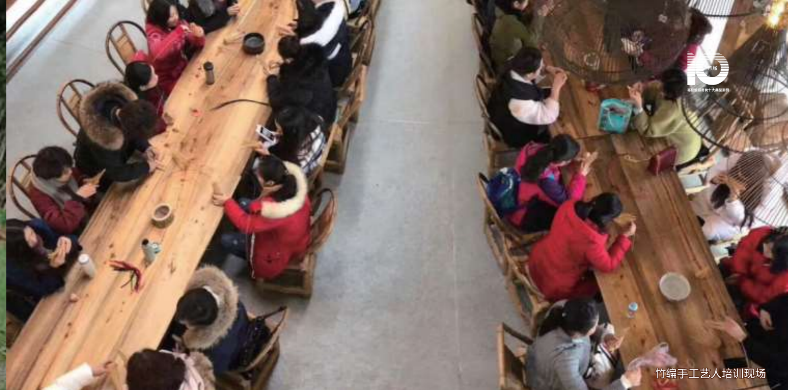
竹编手艺人培训现场