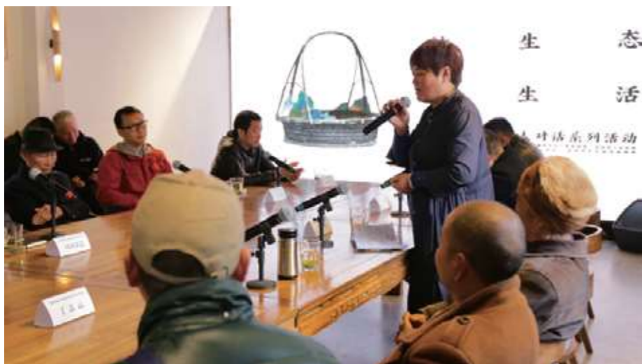
中央美术学院驻四川成都传统工艺工作站举办多场传承人对话会议

开展传承人对话会议。聘请中外艺术家、设计师、知名传承人、授权机构、市场推广机构等与当地的传承人进行面对面的交流。