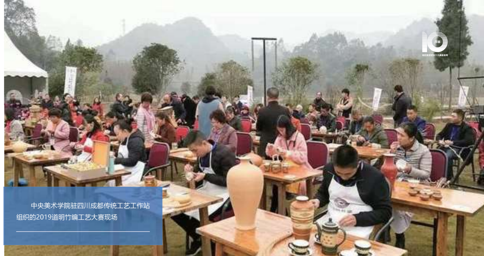
中央美术学院驻四川成都传统工艺工作站组织的2019道明竹编工艺大赛现场