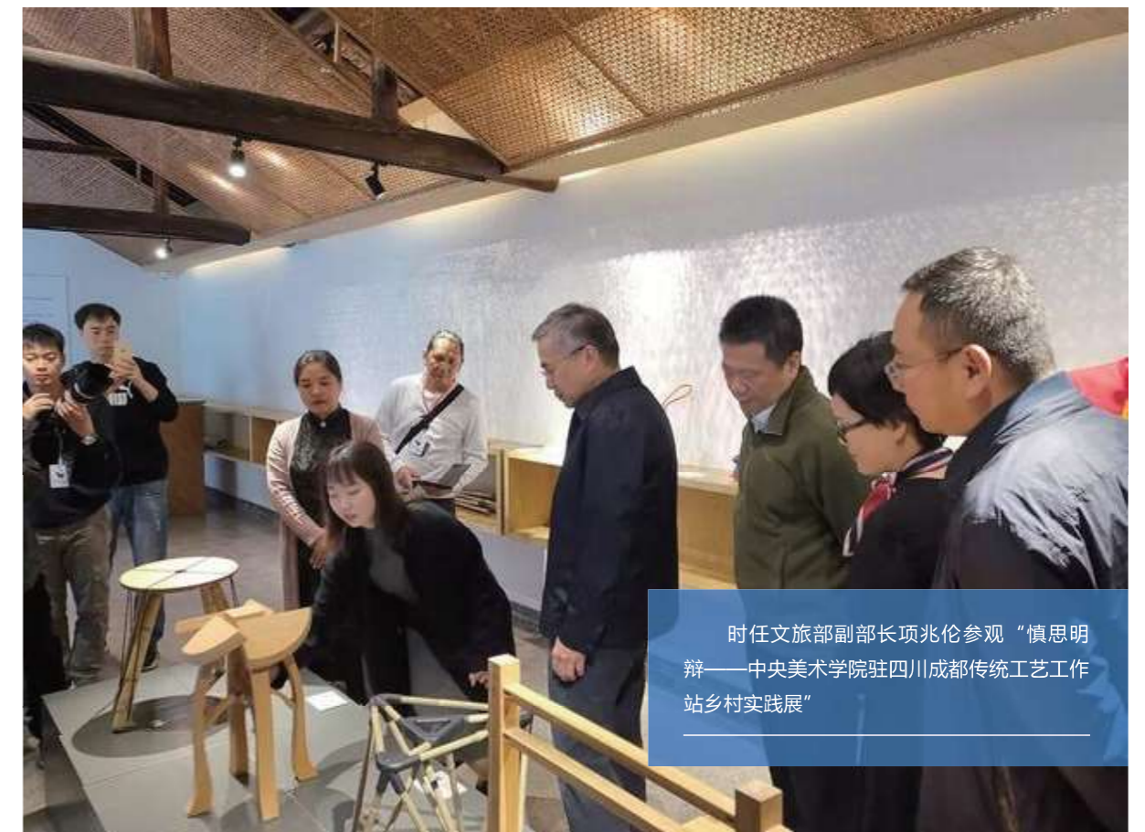
时任文旅部副部长项兆伦参观“慎思明辨——中央美术学院驻四川成都传统工艺工作站乡村实践展”

与当地政府建立合作机制，驻站单位中央美术学院与崇州市政府签定战略合作协议，为当地政府决策提供咨询服务、创意设计服务和文化建设服务等。