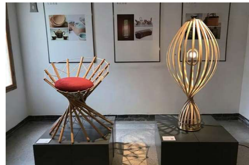
中央美术学院学生以竹为元素的毕业创作